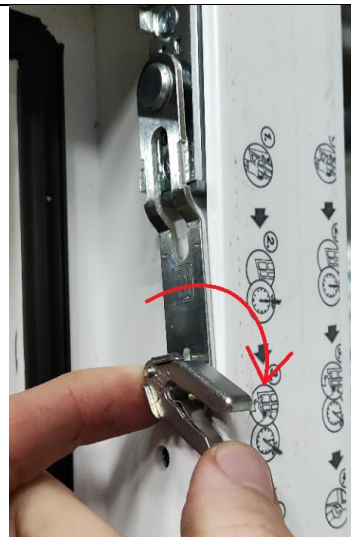
Figuur 8 Hevel omdraaien