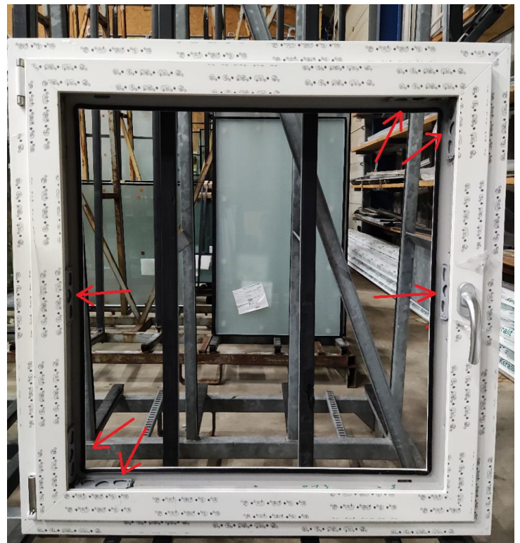
Figuur 6 Plaatsing van de bruggen