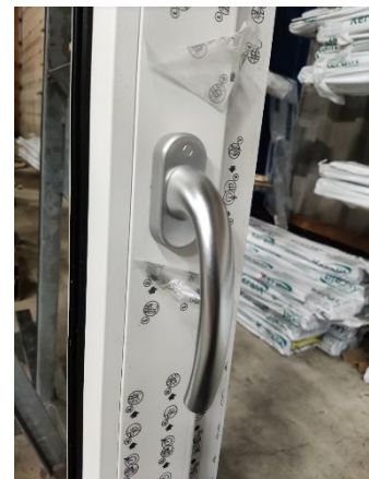
Figuur 3 Kruk gemonteerd en afdekkapje gedraaid