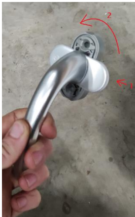
Figuur 1 Afdekplaatje Kruk optillen en draaien