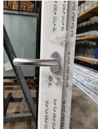
Figuur 5 Kruk vlak (in open stand)