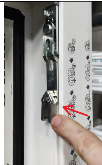
Figuur 9 Spaltluffer naar achteren duwen