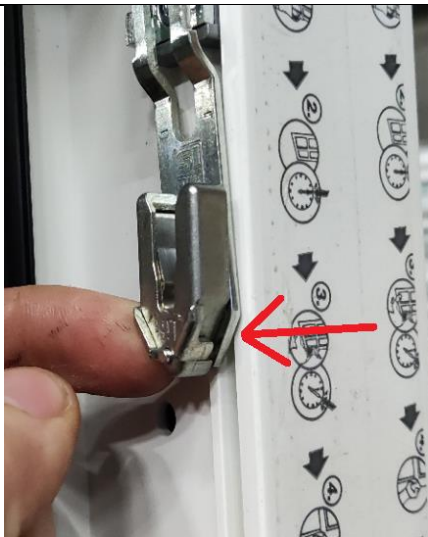
Figuur 7 Palletje uittrekken