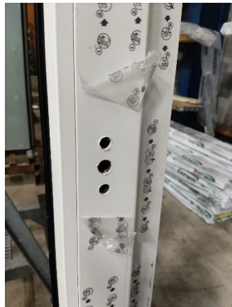
Figuur 2 Sticker van draaikiëpvleugel verwijderen