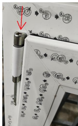
Figuur 4 Pen uit bovenste scharnier